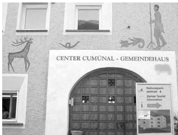
L'anteriura Chasa dal PNS es uossa il nouv Center cumünal da Zerne.

(anr/mfo) Avant bundant ün on ha il cumün da Zerne surdat il Chastè Planta-Wildenberg – il qual serviva sco administraziun cumünala – al PNS. In barat ha il cumün surtat l'anteriura Chasa dal PNS cun l'intent da realisar là l'administraziun cumünala ed üna nouva scoulina. «Nus vain fat duos voutas müdada cun tuot noss'administraziun», declera il president cumünal da Zerne, Domenic