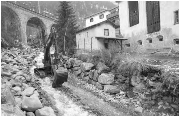
Cun agüd da maschinas as fortifichescha ils cuntschets lung il Lavinuoz per evitar dons vi da las chasas e punts.