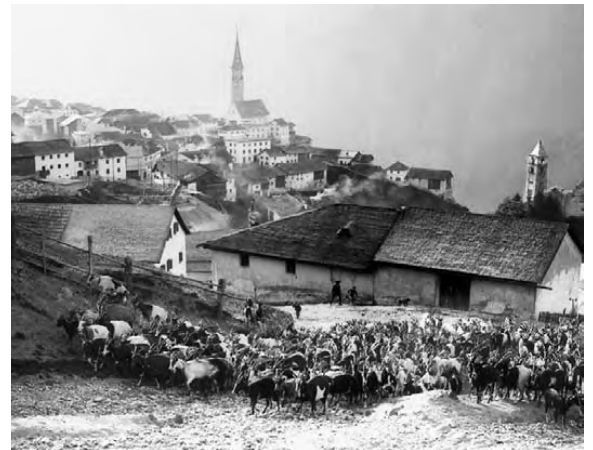
Üna trentina da quistas fotografias as po admirer in l'exposiziun.

Rico Valär e deplorescha unicamaing cha nu s'oda mè la vusch da Linsel sves.