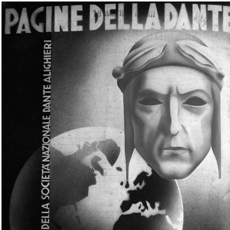
Pagine della Dante , eine der propagandistischen Zeitschriften Norditaliens der 1930er Jahre.