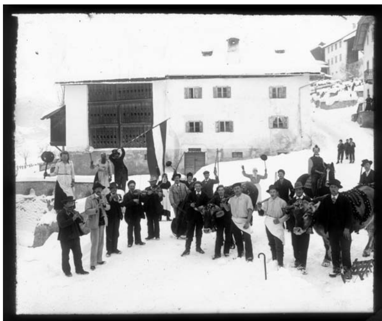
«Bacharia a Sent», um 1915